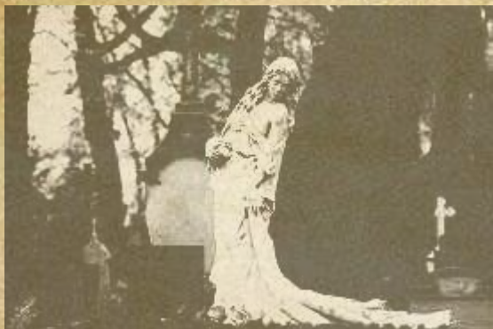
Jedna z mogił na Cmentarzu Powązkowskim, na którym pochowany został ks. M. K. Sarbiewski.

Ks. Maciej Kazimierz Sarbiewski zmarł nieoczekiwanie na skutek udaru, w momencie, gdy wygłaszał on swoje ostatnie, pożegnalne kazanie w kościele św. Jana Chrzciciela w Warszawie. Miało to miejsce 2 dnia kwietnia 1640 roku. Mawia się, że miał on trzy pogrzeby, dlaczego? Początkowo został on pochowany w podziemiach kościoła Jezuitów w Warszawie, jednak gdy w 1834 roku zakon jezuitów został poddany kasacie jego ciało zostało przeniesione do podziemi kościoła pw. św. Pryma i Felicjana. Gdy wybuchło powstanie listopadowe carskie władze, chcąc zgasić płomień polskiej tożsamości narodowej, jego ciało złożyli na cmentarzu Powązkowskim w mogile zbiorowej.