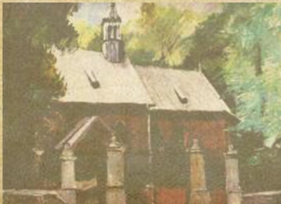
XVII wieczny drewniany kościół w Sarbiewie