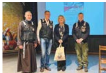
Autorka z organizatorami Zlotu

– dziennikarka, prozaik, poetka, dr nauk humanistycznych z zakresu historii, animatorka kultury. Publikuje w prasie polskiej i polonijnej, wygłasza odczyty na konferencjach naukowych. Jest autorką kilkunastu książek związanych z dziedzictwem narodowym, w tym o losach polskiej emigracji. Wydała też siedem zbiorów poezji. Wielokrotnie nagradzana i odznaczana, m. in. Krzyżem Kawalerskim Orderu Odrodzenia Polski „Polonia Restituta” oraz Brązowym Medalem „Zasłużony Kulturze Gloria Artis”.