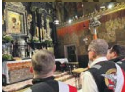
U Jasnogórskiej Pani

Radośnie i widowiskowo – w słońcu i z modlitwą – rozpoczęto nowy sezon motocyklowy. W dniach 15–16 kwietnia 2023 r. około 40 tysięcy motocyklistów, nie tylko z Polski, pielgrzymowało na Jasną Górę. Był to jubileuszowy XX Motocyklowy Zlot Gwiazdzysty im. ks. Zdzisława Peszkowskiego.